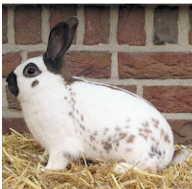
Der Bundessieger 2011: W169-4033, 97,5 Pkt.